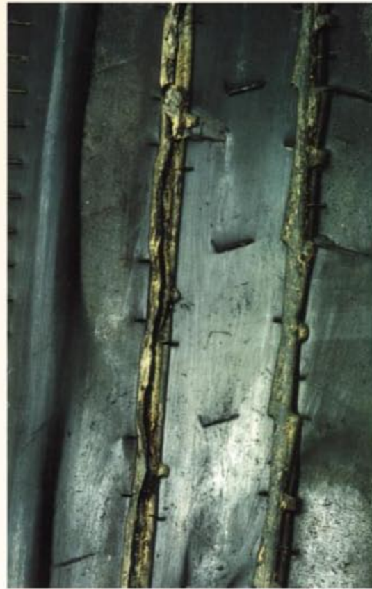
Fotos: Guia de Análisis de Condiciones para La Llanta (Neumatico) Radial