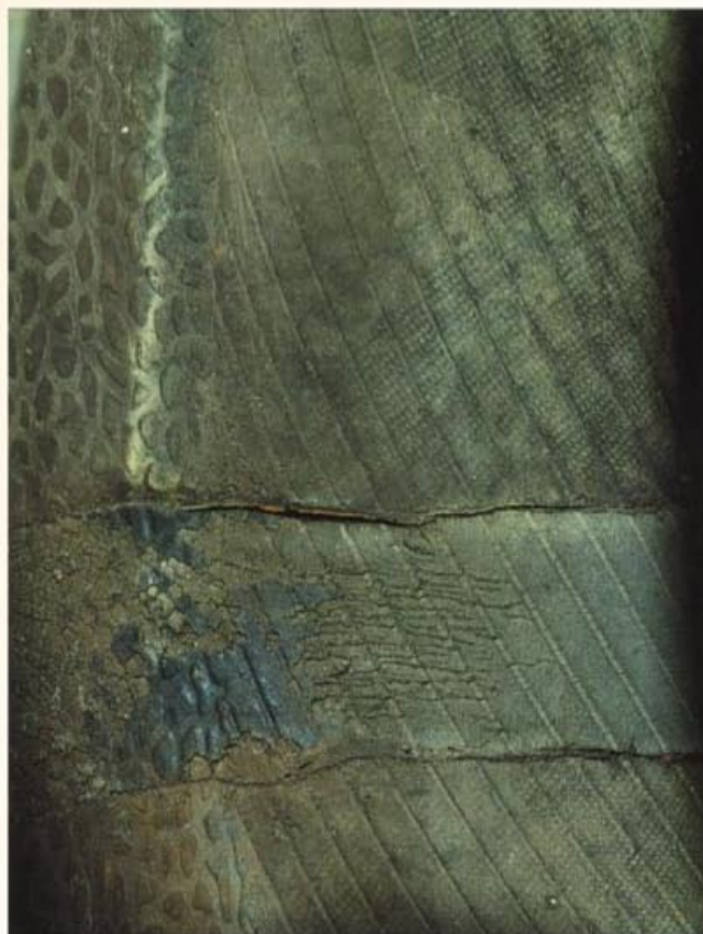
Fotos: Guia de Análisis de Condiciones para La Llanta (Neumático) Radial