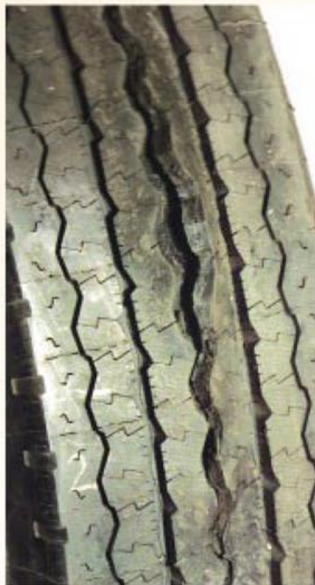
Fotos: Guia de Análisis de Condiciones para La Llanta (Neumático) Radial