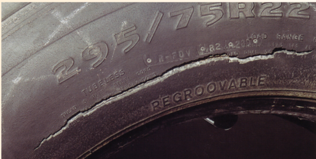
Fotos: Guia de Análisis de Condiciones para La Llantia (Neumatico) Racial