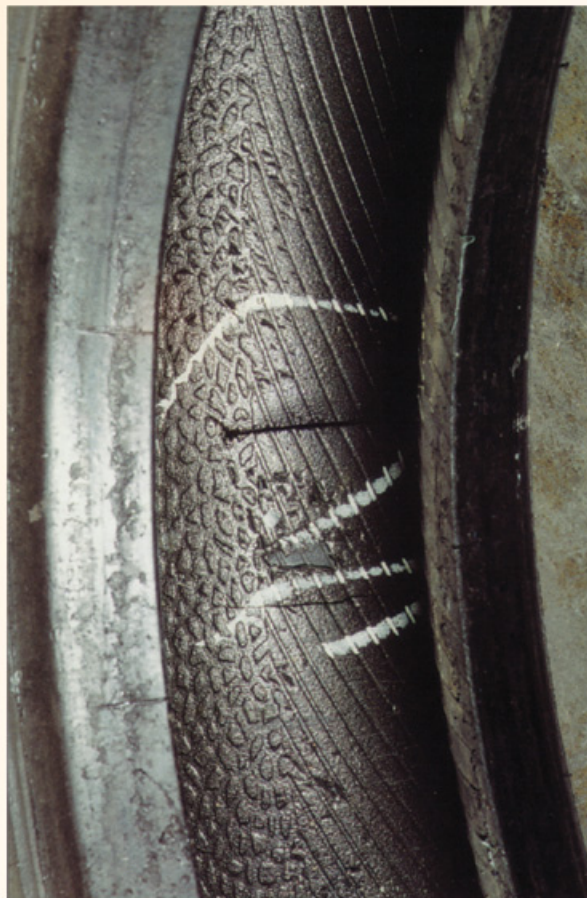
Fotos: Guia de Análisis de Condiciones para La Llantia (Neumatico) Radial