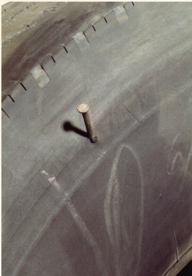
Fotos: Guia de Análisis de Condiciones para La Lianta (Neumatico) Racial