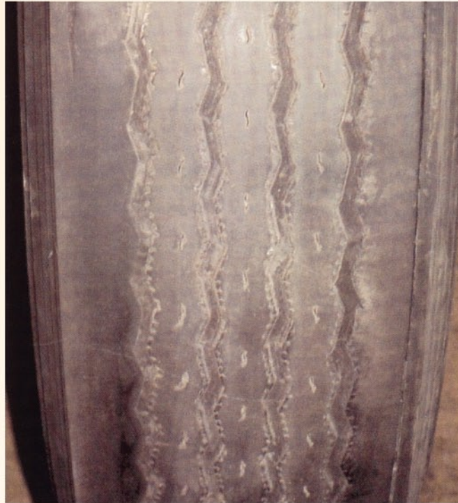
Fotos: Guia de Análisis de Condiciones para La Llantia (Neumatico) Radial