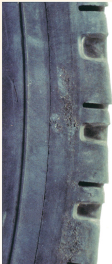
Fotos: Guia de Análisis de Condições para La Llantia (Neumático) Radial