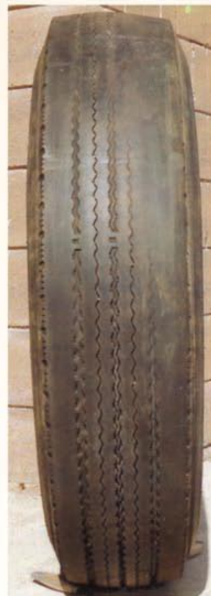
Fotos: Guia de Análisis de Condiciones para La Llantia (Neumatico) Radial