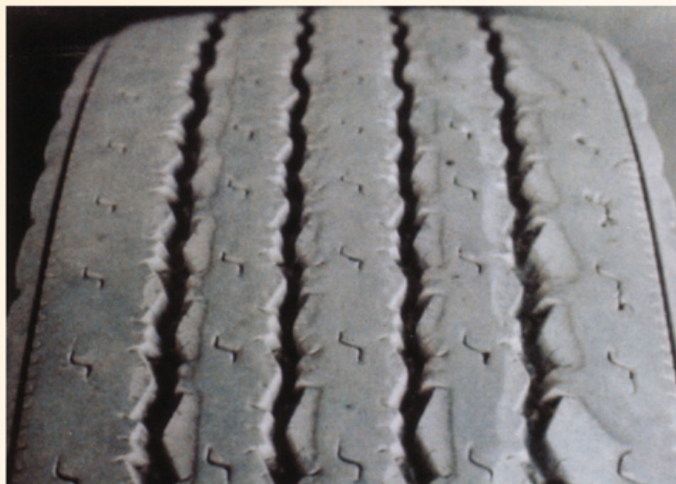
Fotos: Guia de Análises de Condições para La Llantia (Neumático) Recital