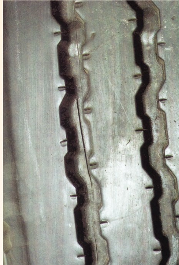
Fotos: Guia de Análisis de Condiciones para La Lianta (Neumatico) Radial