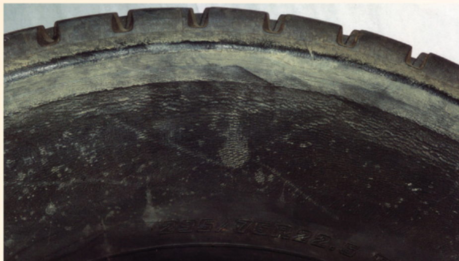
Fotos: Guia de Análisis de Condiciones para La Llantia (Neumático) Racial