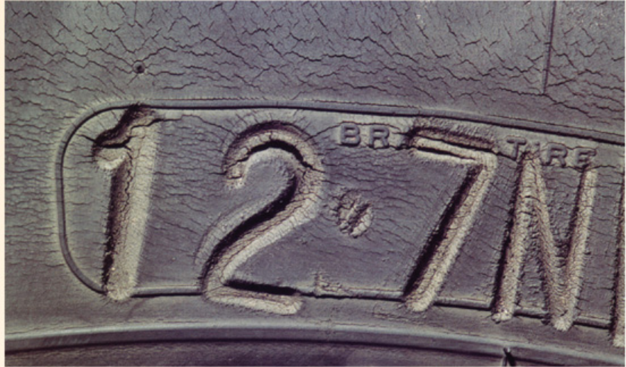
Fotos: Guia de Análisis de Condiciones para La Lienta (Neumático) Radial