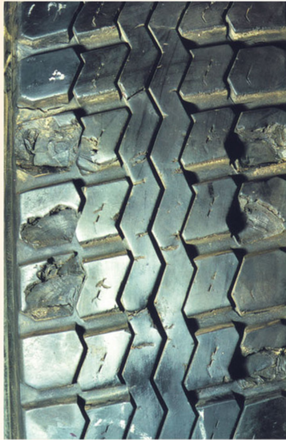
Fotos: Guia de Análises de Condições para La Lienta (Neumático) Radial