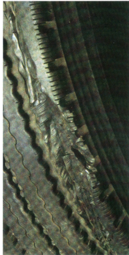
Foto: Guia de Análisis de Condiciones para La Lianta (Neumático) Radial