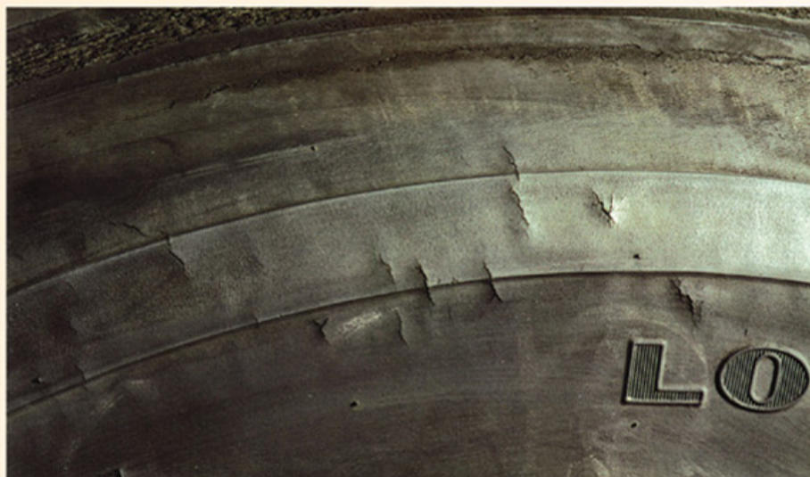
Fotos: Guia de Análisis de Condiciones para La Llantia (Neumatico) Racial