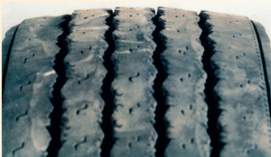
Fotos: Guia de Análisis de Condiciones para La Llantia (Neumático) Racial